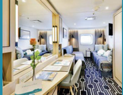
2-Bett-, Saturn-/Orion-/Promenaden-Deck (Kat. K, L, M, O, O1)