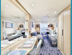
2-Bett-Superior, Balkon, Promenaden-/Lido-/Jupiter-Deck (Kat. O+, P, R)