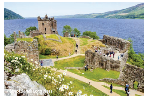
Schottland Loch Ness

Deutsche Staatsbürger benötigen einen bis nach Reiseende gültigen Reisepass. Bitte beachten Sie: Seit dem Brexit benötigen Sie für diese Reise einen Reisepass. Ein Personalausweis genügt nicht.