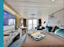
2-Bett-Junior-Suite, Balkon, Panorama-Deck (Kat. T)