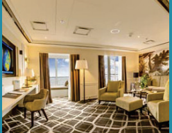
2-Bett-Royal-Suite, Balkon, Jupiter-Deck (Kat. S)