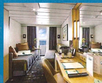
2-Bett, Superior, Balkon, Orion-Deck (Kat. P, PG)