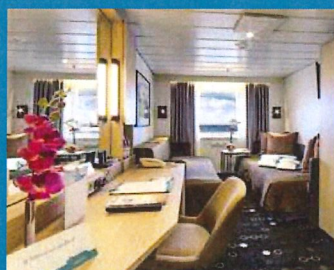
2-Bett, Saturn-/Orion-Deck (Kat. I, K, L, M)