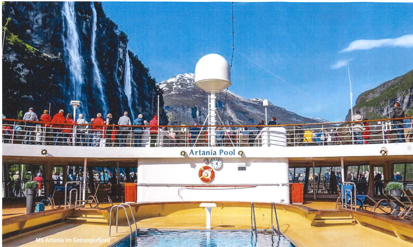
MS Artania im Geirangerfjord