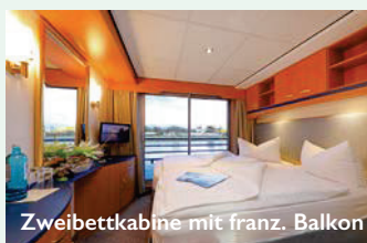
Zweibettkabine mit franz. Balkon