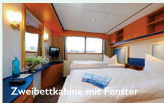
Zweibettkabine mit Fenster